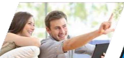
Кредит под залог недвижимости