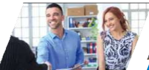
Кредит на развитие бизнеса